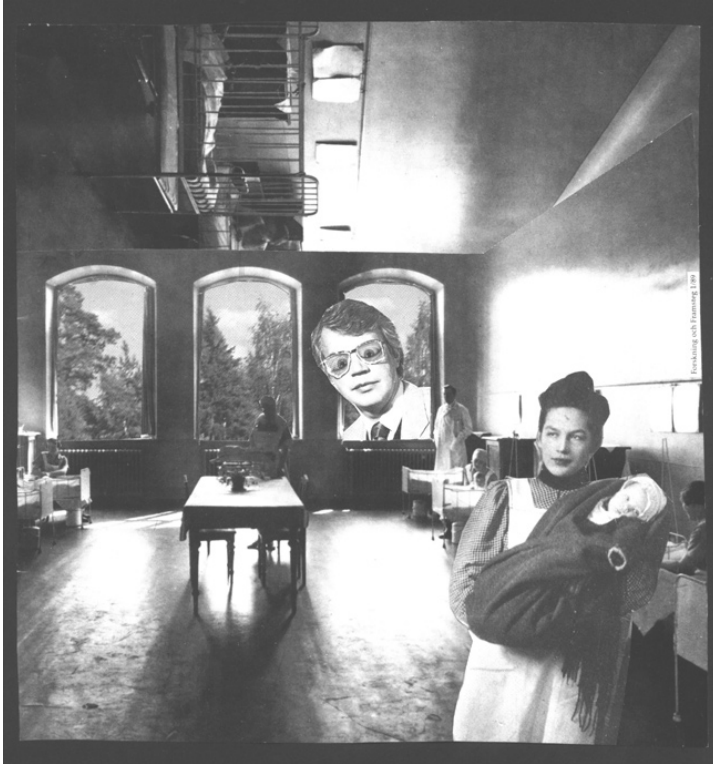
Kollage: Troy Fissella