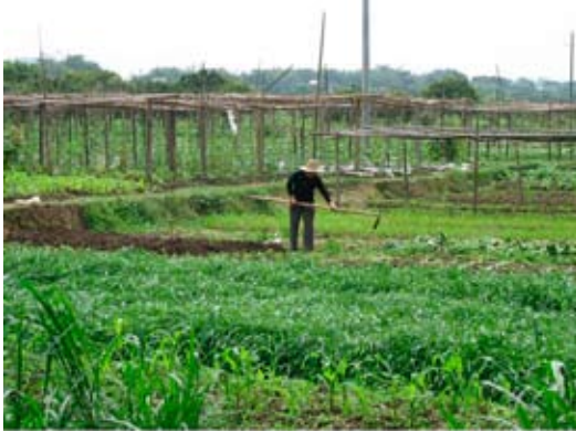
Chuanzhou i Guangxi-provinsen.