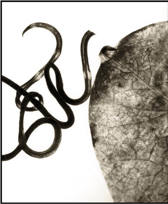
Röröflora 3 sv/v foto