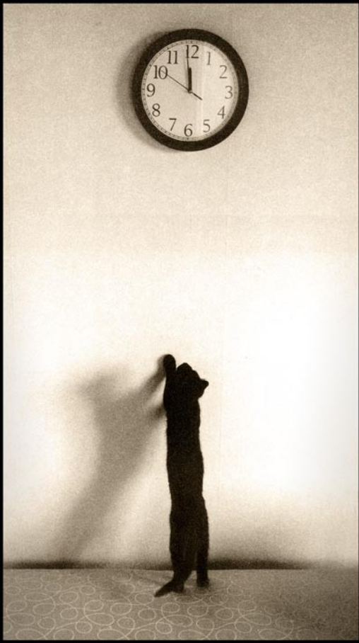
Tolvslaget sv/v foto