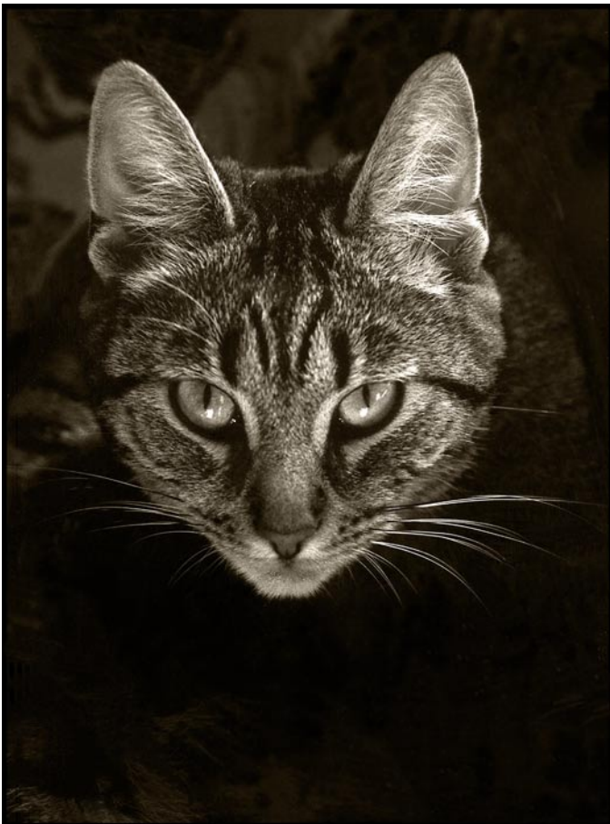
Thisbe sv/v foto