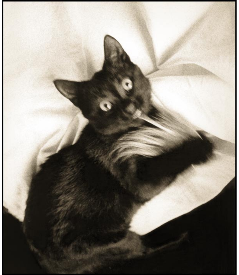
Bettet sv/v foto