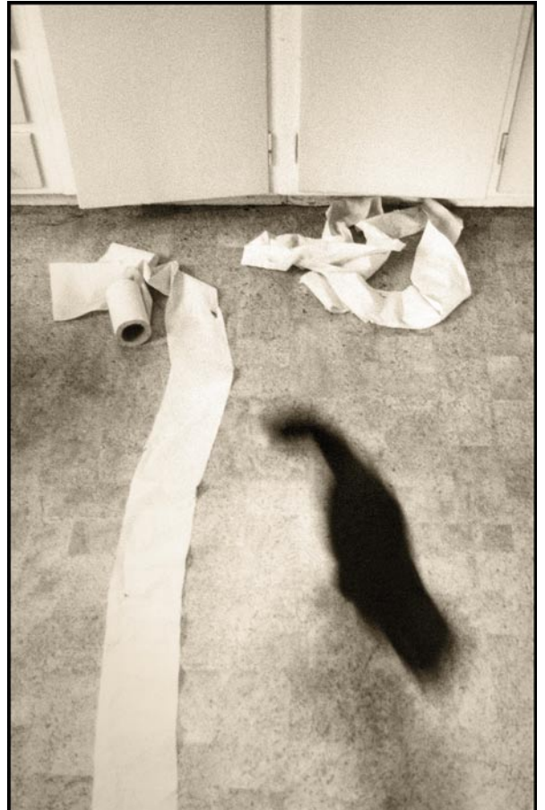
Svartis sv/v foto