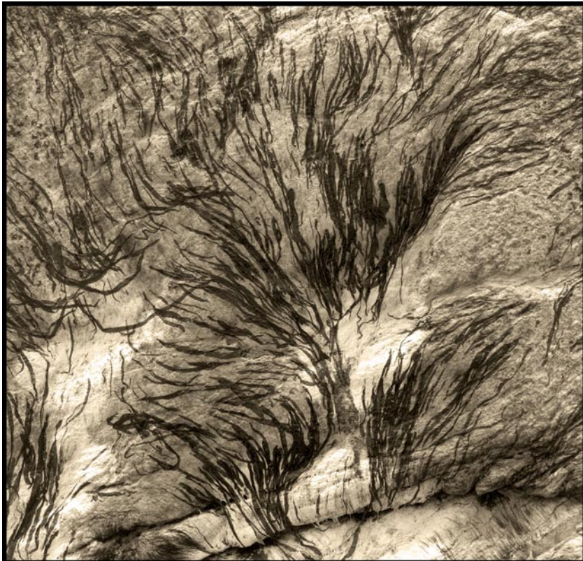
Utan synvinkel 7. sv/v foto