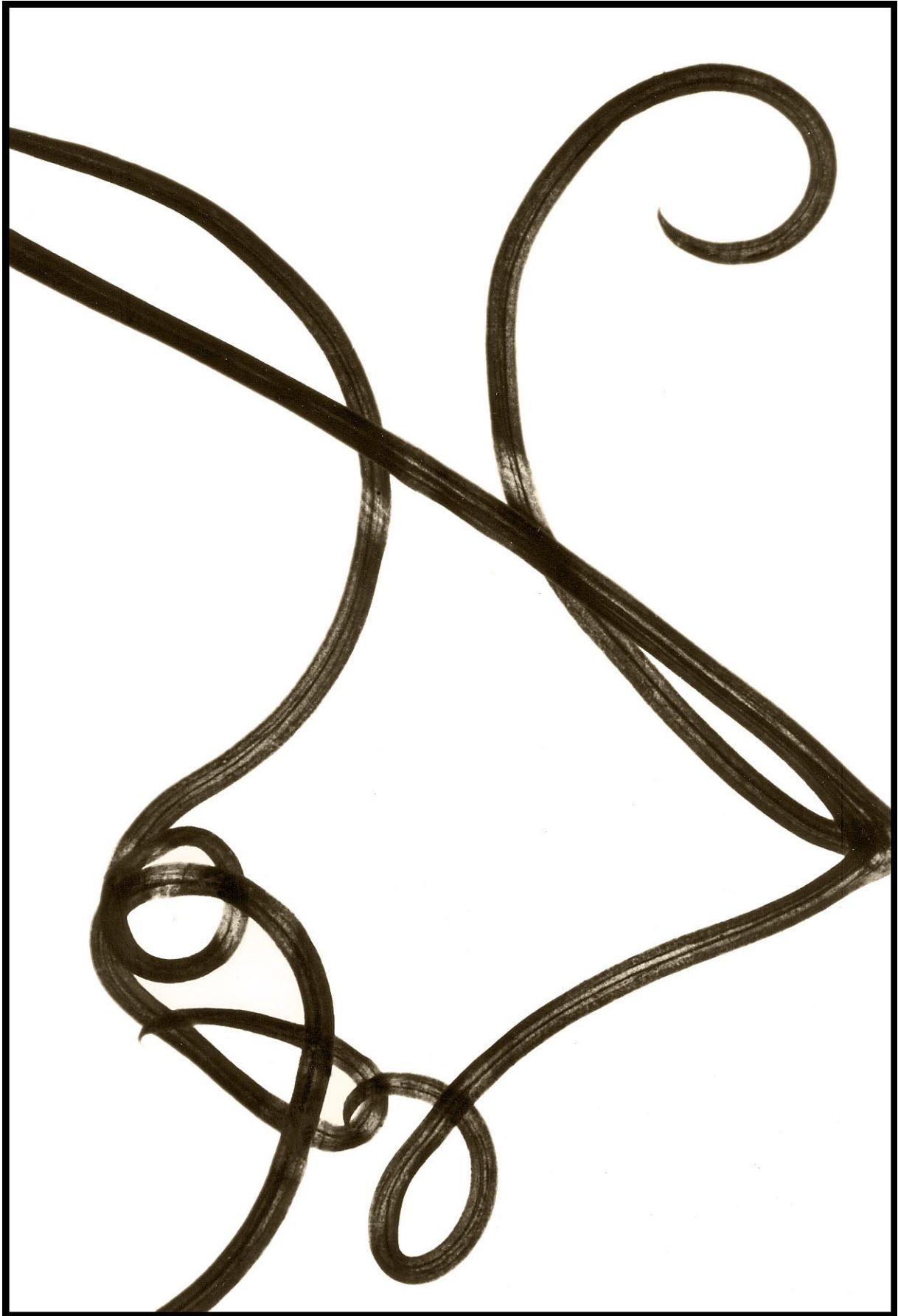
Röröflora 5 sv/v foto