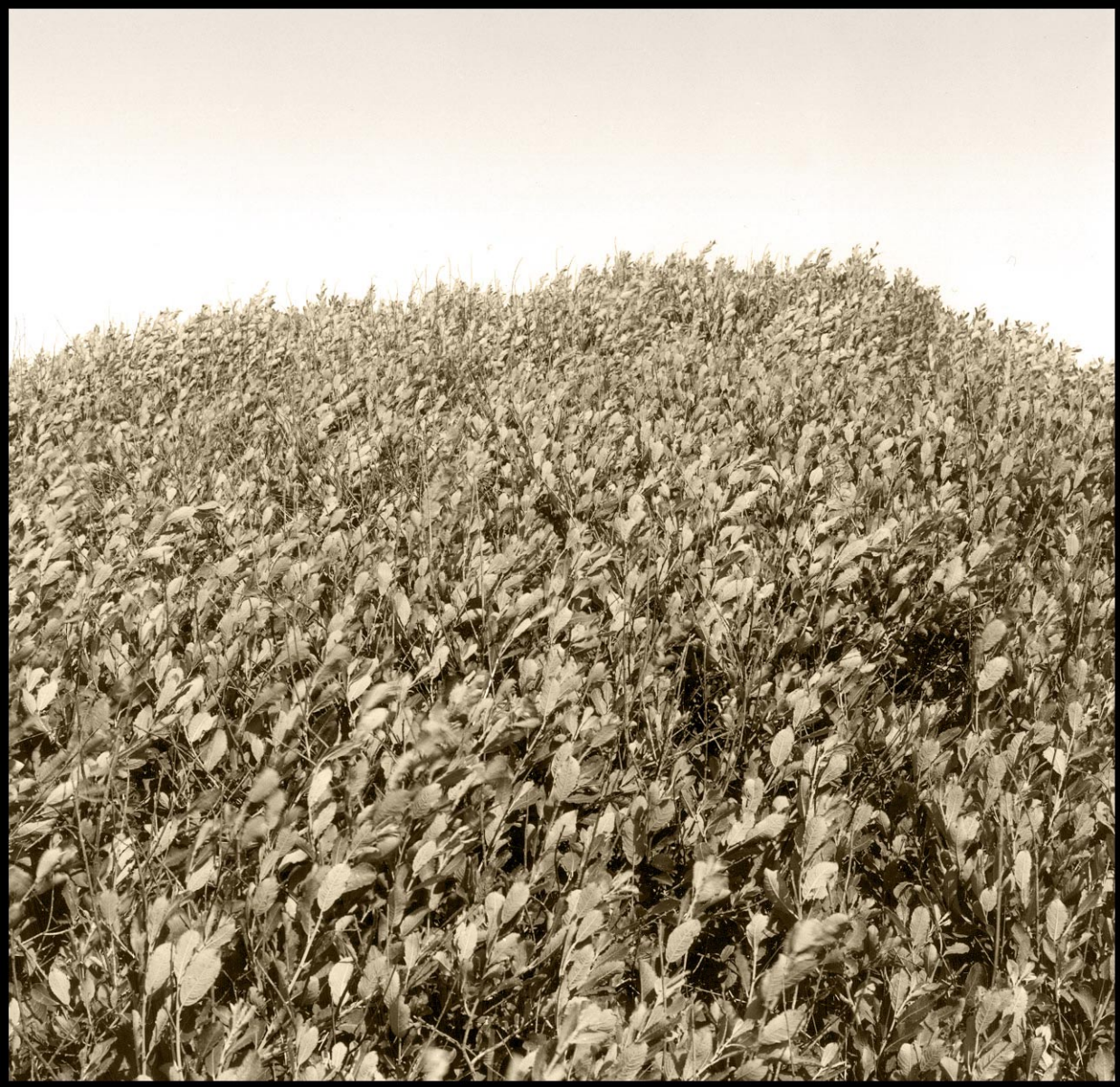
Utan synvinkel 1. sv/v foto