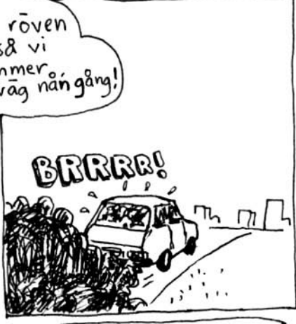
Toyota Starlet 6L - 79