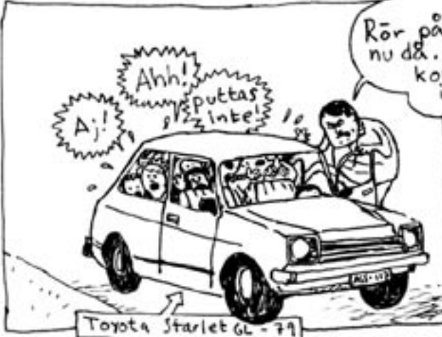
Toyota Starlet 6L-79

Okaj! Dags & hoppa in gubbar, nu drar vi!